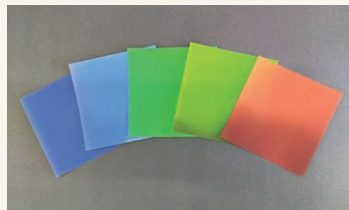
鮮やかな発色と角度依存性