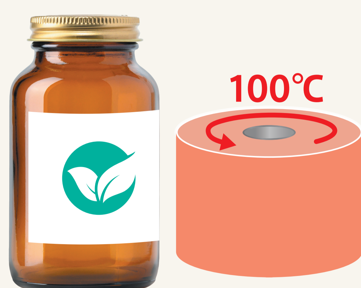
ラベリング時のイメージ